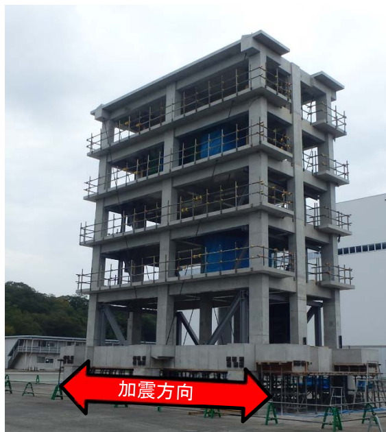
図 2 試験体外観と加震方向